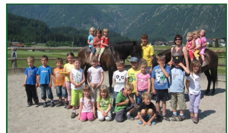
Reiten beim Mooshäusl