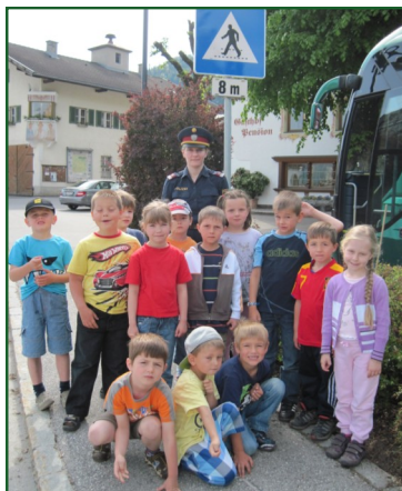
auch die Polizei 122 war dabei