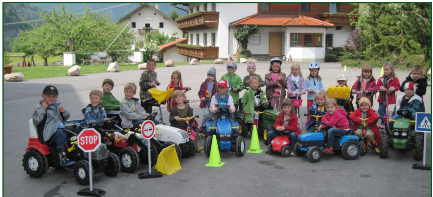
Verkehrschuls beim Ascherwirt

Das Kindergartenjahr 2010/2011 geht zu Ende. Wir vom Kindergarten Brandenburg und Aschau möchten uns recht herzlich für die gute Zusammenarbeit mit allen Institutionen, Gemeinde, Raiffeisenkasse, Feuerwehr, Tennisclub, Schuster, Altenheim, Bäcker, Eisstockclub, Bienenzuchtverein, Ascherwirt, Mooshäusl bedanken und hoffen auf weitere Unterstützung im neuen Kindergartenjahr.