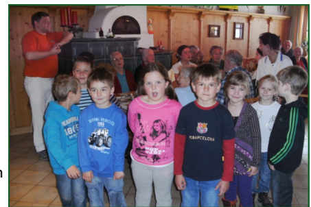
Ostern im Altenwohnheim

Bericht und Bilder: Brigitte Marksteiner