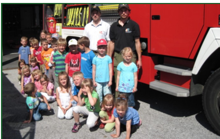
Besuch bei der Feuerwehr