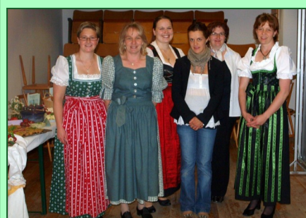
Bericht und Bilder: Bgm. Neuhauser Bilder: Brandenberger Bäuerinnen