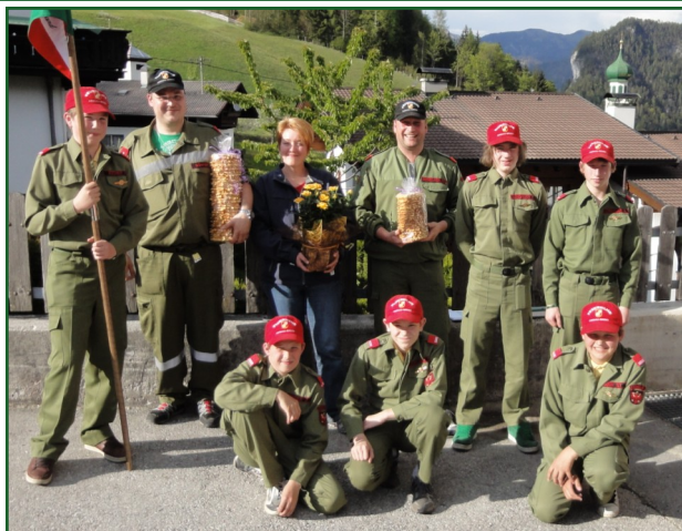
Bericht und Bild: Die stolzen Eltern der „Feuerwehrjugend Aschau“

Dass die „Drei“ ihre Freizeit opfern, um die angehenden Feuerwehrmänner zu lehren und in ihrer Ausbildung zu unterstützen, finden wir beeindruckend!