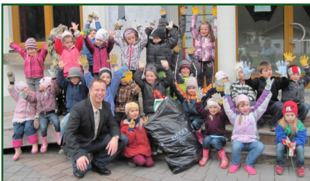
Frühjahrsputz - fleißige Hände halten Brandenburg sauber